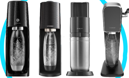
Sparkling Water Makers