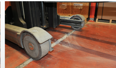
תפר בטון לפני - מפגע בטיחות