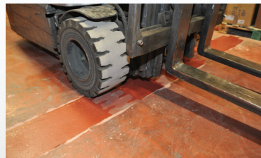
תפר בטון אחרי - מעבר חלק